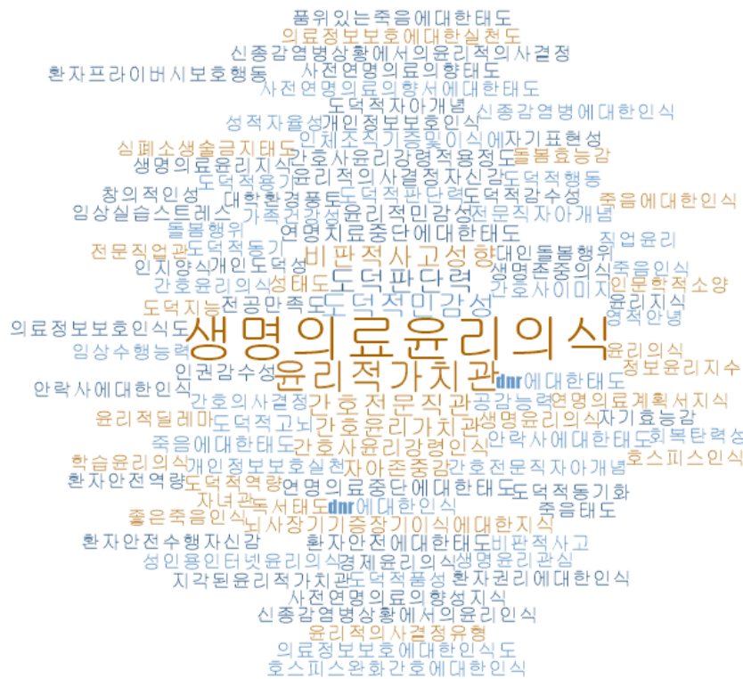
Figure 3. Word cloud of research variables.

윤리적 문제해결 관련 세부 주제의 경우, 도덕적 판단력 10편 (7.6%), 윤리적 의사결정 및 실천이 9편(6.9%)의 순으로 수행되었다. 도덕적 판단력에 대한 연구는 2015년까지 꾸준히 이루어졌으나 2016년 이후에는 없었다. 윤리적 의사결정 및 실천에 대한 연구는 2016년 이후 8편으로 크게 증가하였다. 윤리교육의 효과에 대한 연구는 2006년 이후 꾸준히 증가하여 2006~2010년 3편, 2010~2015년 8편, 2016년 이후 11편 발표되었다(Table 1).